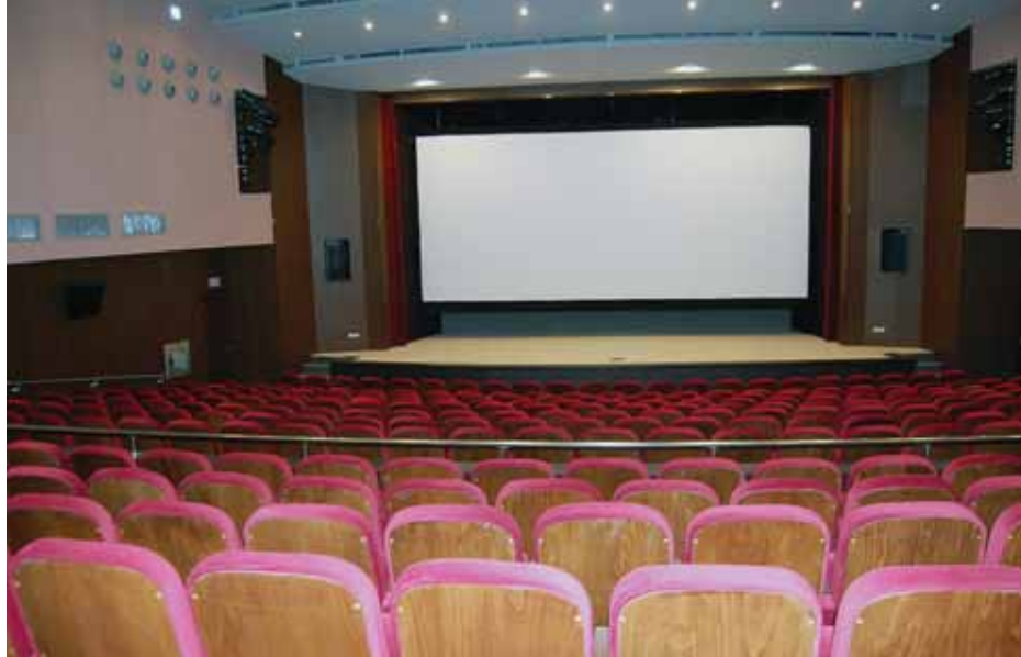
Зрителна зала в читалище "Просвета - 1888"

Поради неприемане на докладната от общинския съвет, Община Поморие се лиши от възможността да концесионира тези природоизточници и от последващи възможности да се открият работни места и да постъпят приходи в общината.