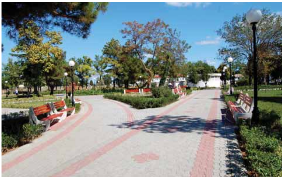
Озеленен парк около НЧ „Светлина - 1939“

Друга форма на привличане на инвестиции е да се използват публично-частни партньорства.