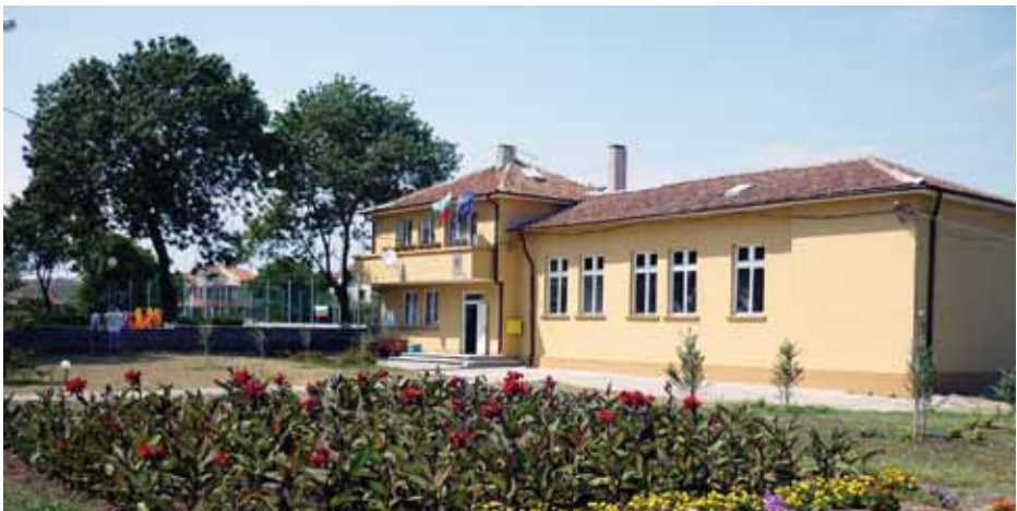
Обновената сграда на кметството в с. Каменар

▶ Проучва се възможността чрез модерна технология да се извършва пълна обработка на битовите отпадъци в претоварната станция с цел намаляване тежестта на „такса смет” към жителите на Общината.