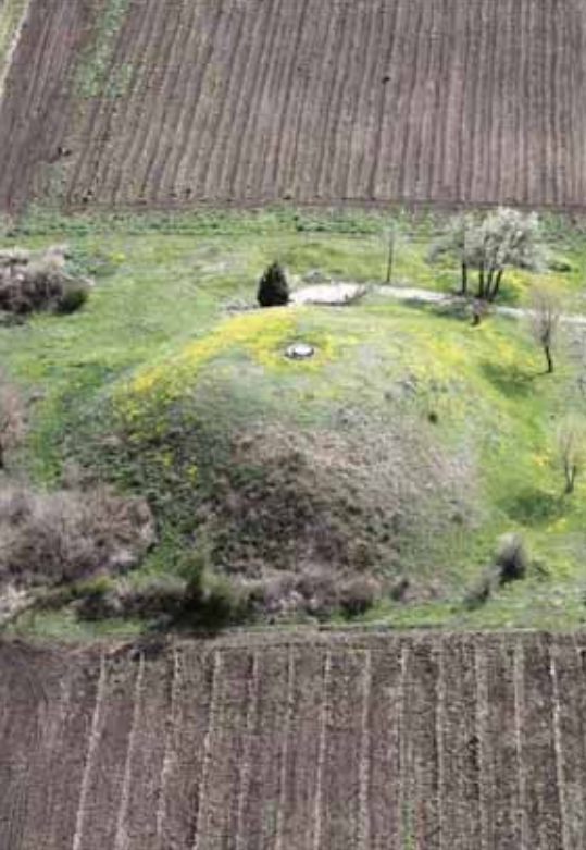
Самолетна снимка на Кухата могила в историко-археологическия комплекс Палеокастро, в която се намират Мавзолея на последните тракийски царе

ди Община Поморие като център за орнитоложки туризъм