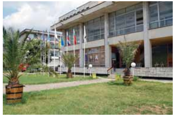
Зелени площи пред Туристически информационен Център гр. Поморие

▶ Приключила е процедурата по избор на изпълнител за I етап - участъкът от Морско казино до квартал Св. Георги, като е подписан договорът за изпълнение