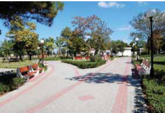
Благоустроен район пред читалище „Светлина - 1939“

▶ Изпълнен бе първият етап от проекта за канализация на Габерово