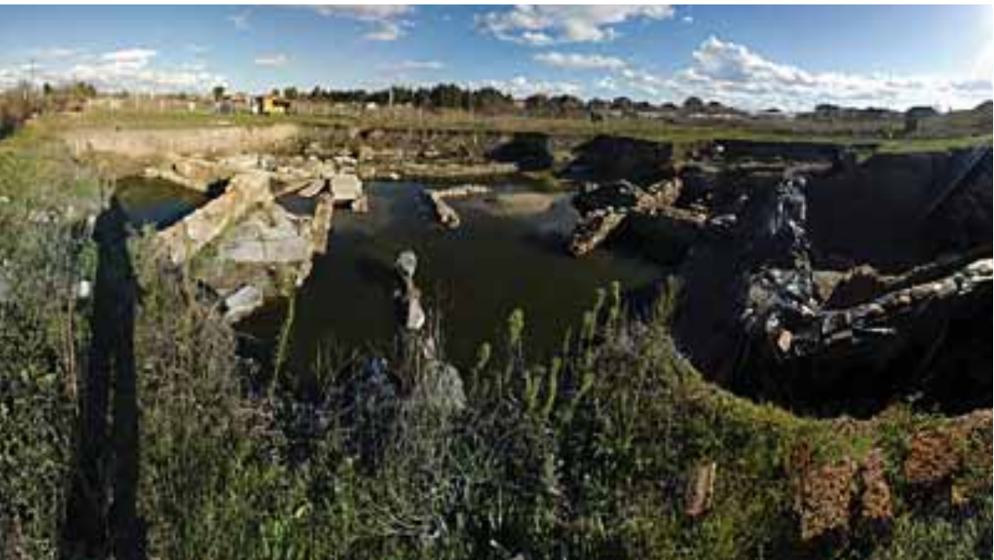
Изглед от разкопките на римския Улпия Анхило в историко-археологическия комплекс Палеокастро през 2011 г.