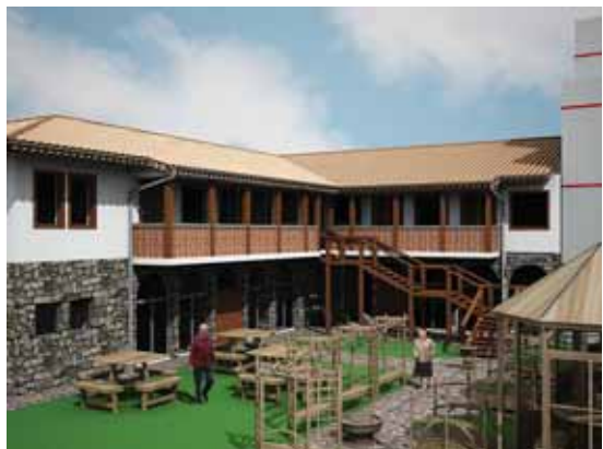
Дневен център за възрастни хора в град Каблешково - проект

зар в гр. Каблешково и възстановяване на зелените площи