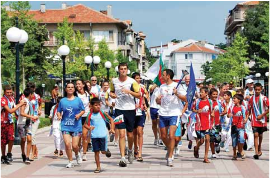
Приобщаване на Поморие към Световния пробег на хармонията през 2010 г.