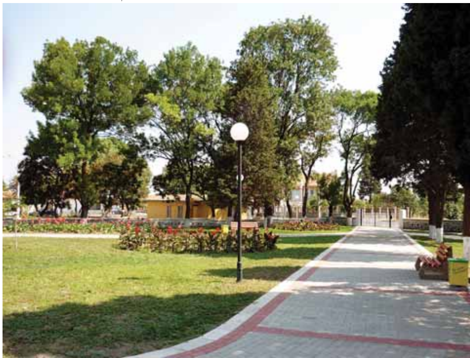
Парк в с. Каменар

► Реализира се новото кръстовище на ул. „Солна” и ул. ”Проф. Стоянов” гр. Поморие