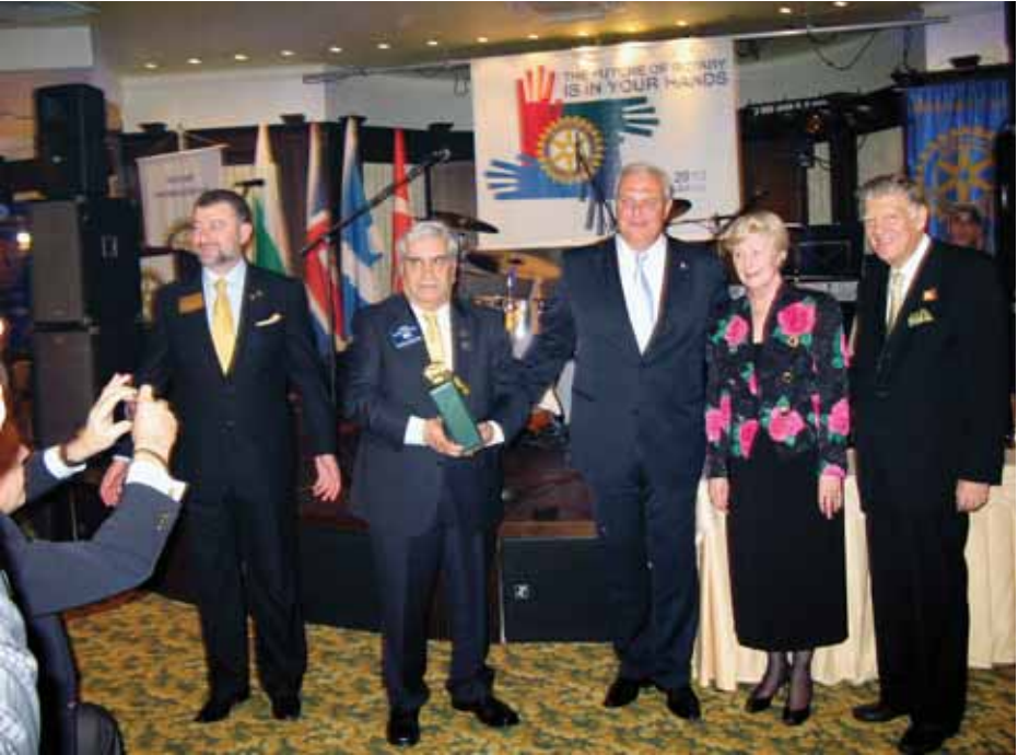
Среща с президента на "Ротари митнейшънъл" г-н Джон Кели