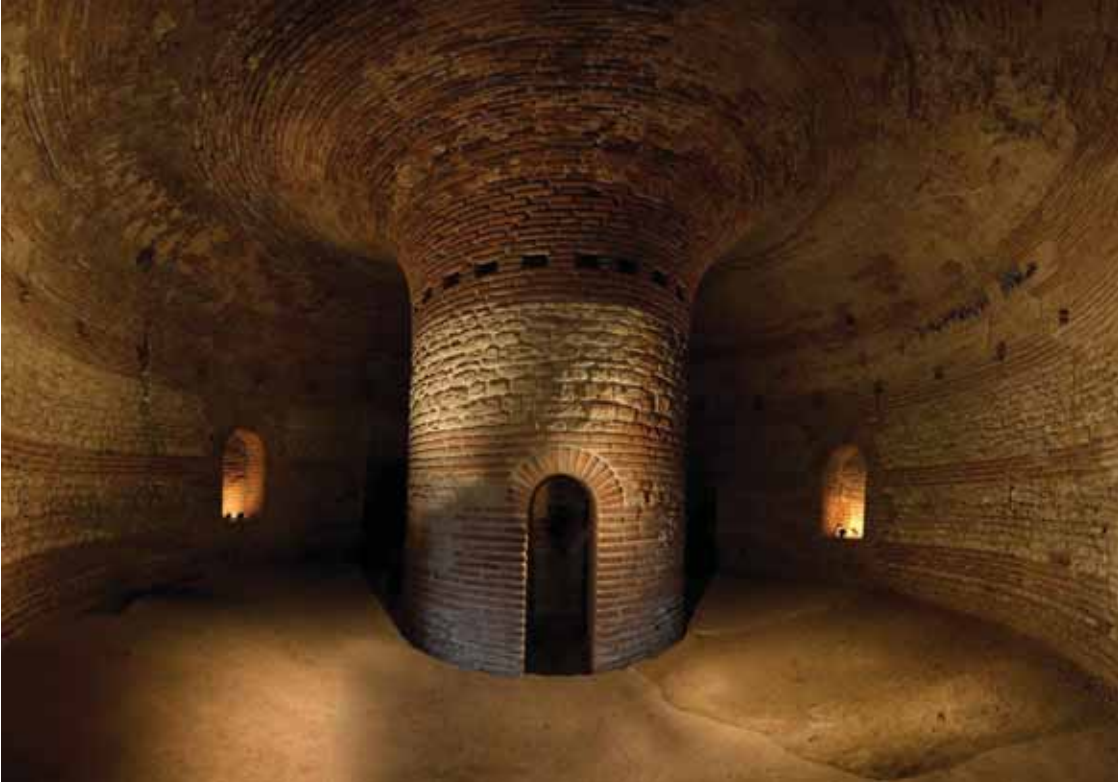
Изглед от вътрешността на Мавзолея на последните тракийски царе с уникален градеж - историко-археологическия комплекс Палеокастро

международна експедиция за проучване на историко-археологическия комплекс Палеокастро (на суша и под вода).