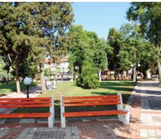
Зона за разходка и отдих в град Поморие