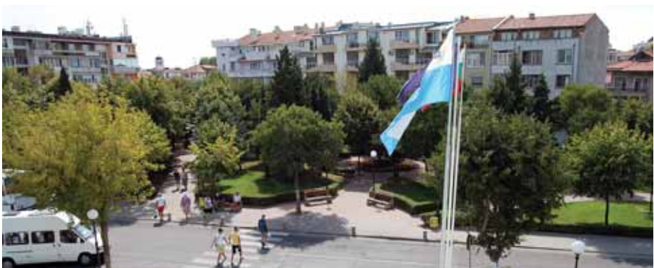
Обновена градинка пред сградата на Общината