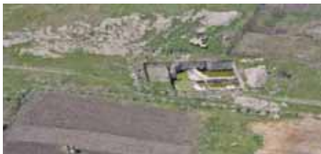
Самолетна снимка на част от историко-археологическия комплекс Палеокастро, където се провежда ежегодна международна експедиция