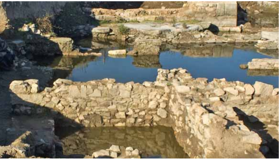
Изглед от разкопките на римския Улпия Анхвало в историко-археологическия комплекс Палеокастро през 2011 г.

През 2011 г. беше възложен и изготвен Проект „Стратегия за използването на културния туризъм в развитието на Община Поморие”. Тя вписва поморийските паметници в „културните коридори” на Югоизточна Тракия и предвижда редица мерки в рамките на десет годишна програма. Започна работа по организирането на комплексна интердисциплинарна